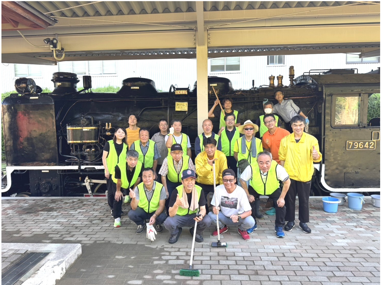
王子の森公園SL清掃